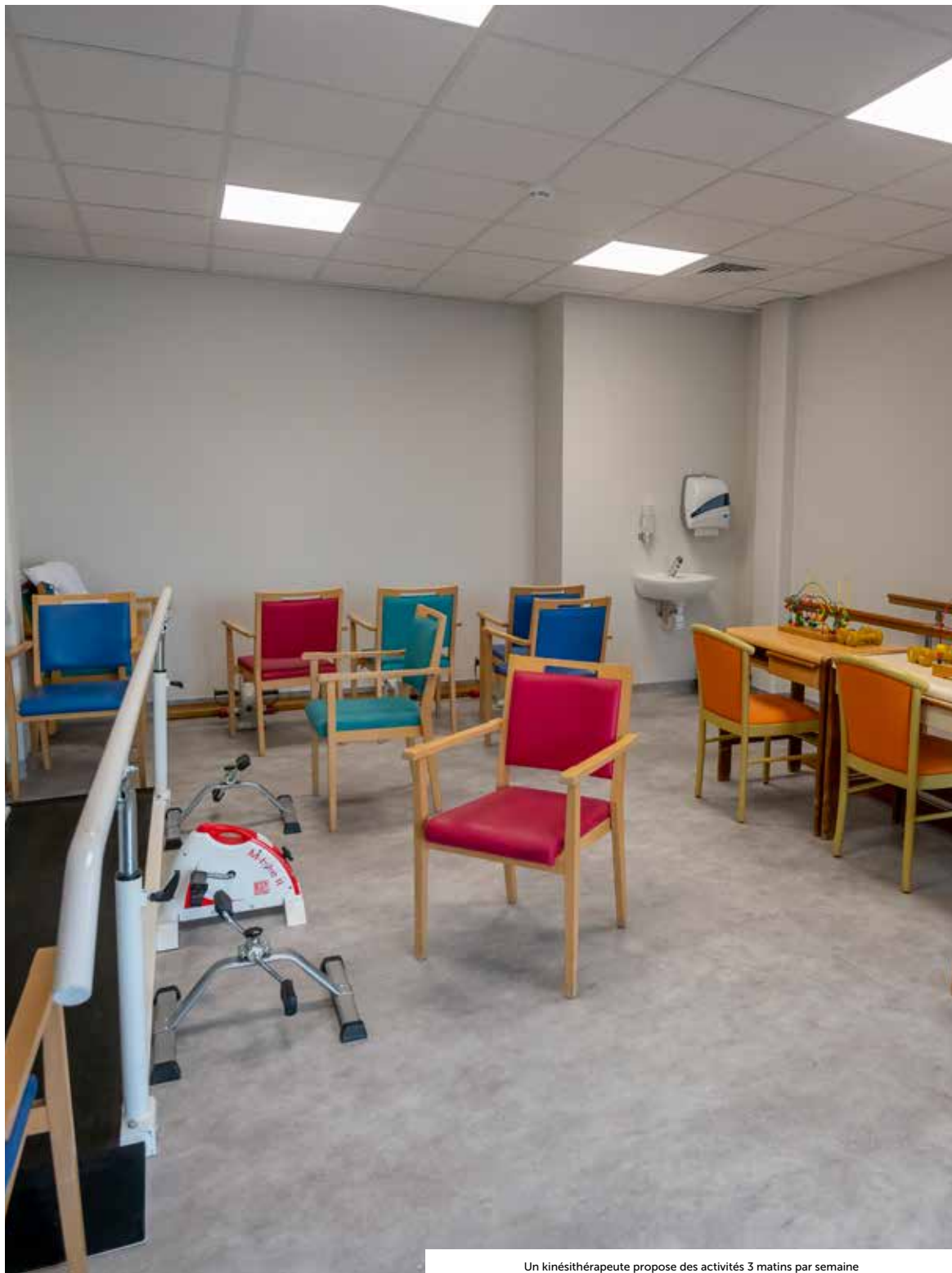
Un kinésithérapeute propose des activités 3 matins par semaine