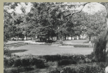
Le parc, son fleurissement et la rivière anglaise après réhabilitation