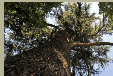
Cèdre de l'Himalaya ( Cedrus deodara )