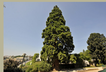
Séquoia géant ( Sequoiadendron giganteum )