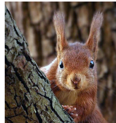
À voir : les écureuils roux ( Sciurus vulgaris )

Victor-Thuillat est l'un des lieux de l'expression du savoir-faire horticole des jardiniers municipaux, acteurs majeurs du développement durable de la Ville. Ils adaptent leurs pratiques à une gestion durable et respectueuse : désherbage manuel, paillage et binette ont remplacé