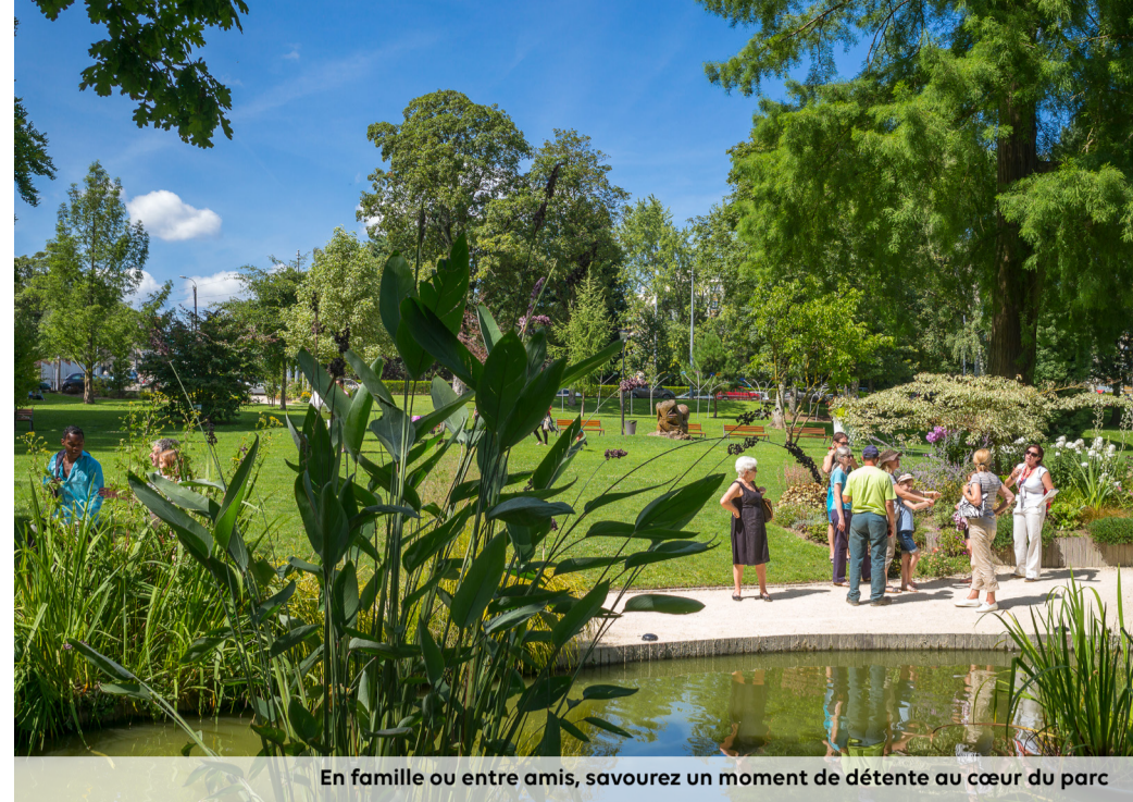
En famille ou entre amis, savourez un moment de détente au cœur du parc