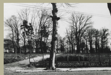
Entrée rue É.-Labussière au début des travaux de réhabilitation - 1967