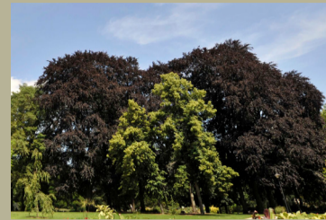
Hêtres pourpres ( Fagus sylvatica var. purpurea )