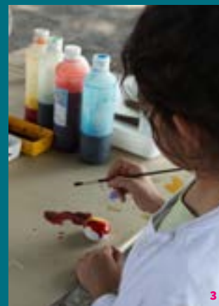
1. Atelier en classe "la ville en valise" 2. Atelier "ArchéoMinots", Villa Brachaud 3. Atelier lors des Rendez-vous aux jardins

Les animations pédagogiques proposées sont pluridisciplinaires. Elles illustrent et complètent le programme d'histoire, de géographie, d'histoire des arts ainsi que de nombreuses autres matières.