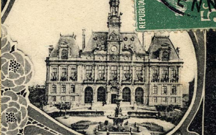
Ancienne carte postale touristique « Souvenirs de Limoges ».