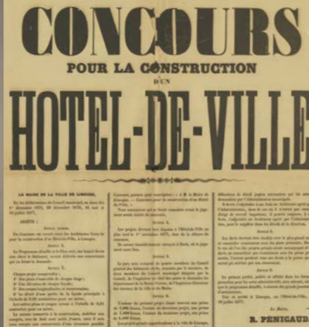
Affiche du concours pour la construction de l'hôtel de ville, 19 juillet 1879.