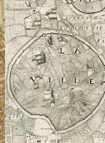
Plan Jouvin, dit des trésoriers, XVII e siècle.