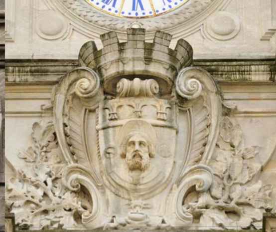
Armoiries de Limoges avec le chef de saint Martial surmonté de trois fleurs de lys.