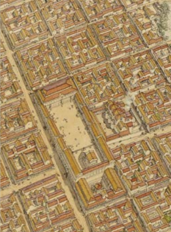
Augustoritum, restitution à l'aquarelle par Jean-Claude Golvin, 2012.