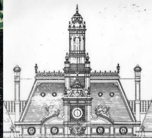
Le campanile de l'hôtel de ville. Détail du dessin du projet d'hôtel de ville par Alfred Leclerc, extrait du « Nouvel hôtel de ville de Limoges » de Paul Ducourtieux.