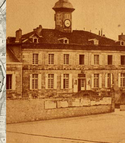
Ancien hôtel de ville, place Saint-Gérald, XIX e siècle.