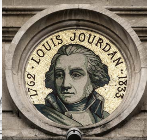
Le maréchal Jourdan (1762-1833), médaillon en mosaïque.